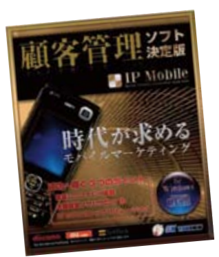
エス・ケイ通信の主 力商品であるIPモ バイル<顧客管理 ソフト>は、同社の 売上げの約7割を 占める。残りの約3 割がソフトバンク関 連だという

株式会社エス・ケイ通信 設立 2000年9月 所在地 東京都渋谷区神泉町10-10 アジジ神泉ビル6F TEL 03-5784-5760 資本金 1900万円 事業内容 ソフトウェアプロダクト及び関連ソフトウェ アの研究開発及び流通・通信機器販売業 URL http://www.sk-t.com/