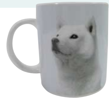
ソフトバンクのお父さん犬マグカップ。毎朝こ のマグカップでコーヒーを飲んで仕事モード に。その一杯は廣瀬氏にとって欠かせない

ほかには、ペンスタンド、文具 入れ、小銭入れ、スタンプ台、電 卓…。それぞれが手にとりやす いように定位置に収まっている。